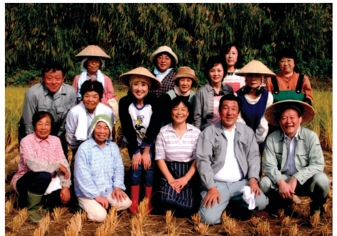
平成21年9月27日 新潟県旧山古志村「幸子田」にて稲刈り