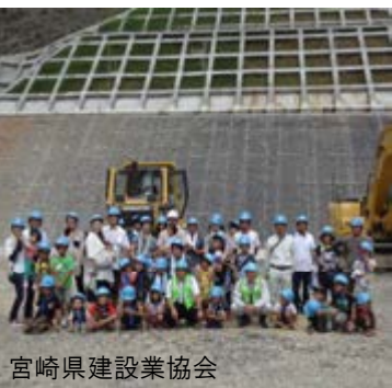
宮崎県建設業協会