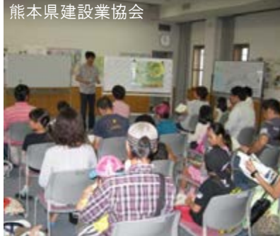
熊本県建設業協会