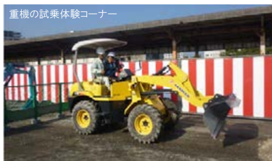
重機の試乗体験コーナー

「利根川水系水防演習」会場にブースを出展し、地域建設業の活動状況のPRを実施。 (千葉県建設業協会、全国建設業協会)