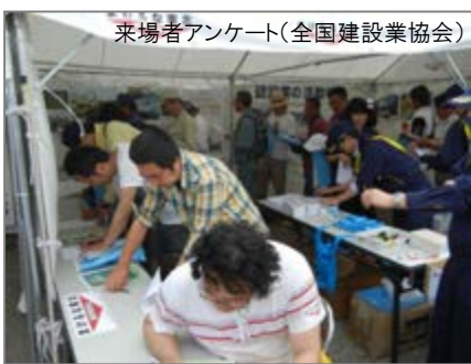
来場者アンケート(全国建設業協会)

○戦略的広報活動の一環として、地域建設業の活動状況等を、全国各地域のイベント会場に展示するなど、PR活動を展開。(全国各地の建設業協会)