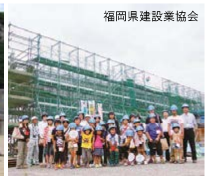
福岡県建設業協会