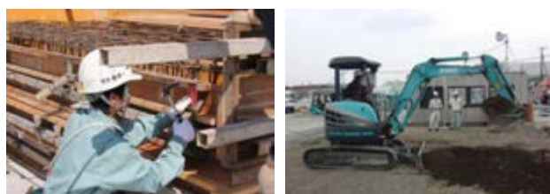
現場実習の様子(栃木県建設業協会)