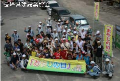
長崎県建設業協会