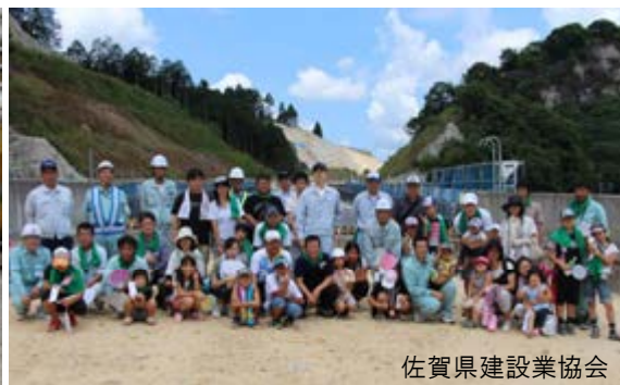
佐賀県建設業協会