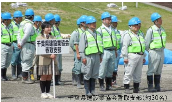
千葉県建設業協会香取支部(約30名)

土木フェスタのイベント会場に重機の試乗体験コーナーを併設し、建設業の仕事を感じてもらおう。 (鹿児島県建設業協会)